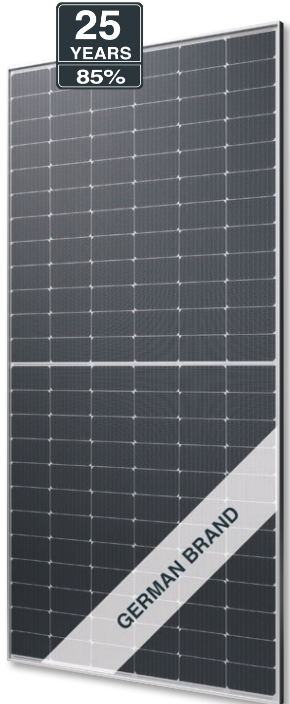
Abb. ähnlich 144MHDE231009A